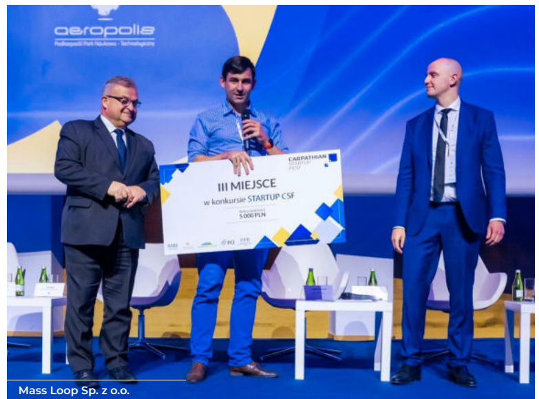
Mass Loop Sp. z o.o.