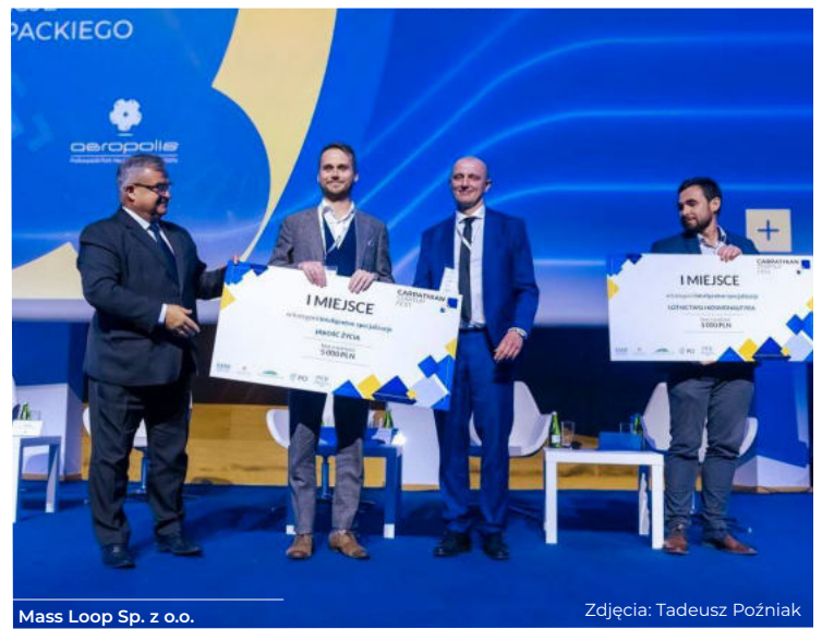
Mass Loop Sp. z o.o.