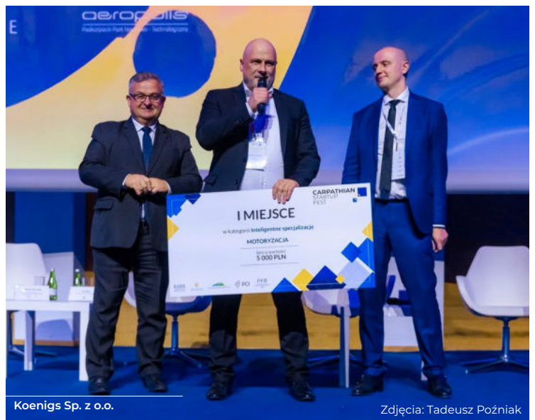
Koenigs Sp. z o.o.